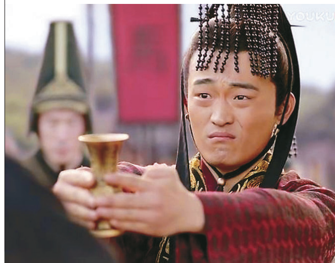
出師時阿斗向孔明敬酒，但酒器卻端上了「巨鬯」。