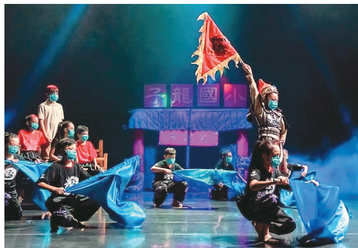
子龍國小的戲劇表演「每個人都要上台」，根據孩子的特質安排角色。

佳里永昌宮建於1691年，根據廟史紀錄，明朝永曆年間，鄭成功率兵來台墾拓，有位林六叔將軍是此區創村始祖。清康熙年間，有村人撿到漂流木，上頭被白蟻咬成「常山趙子龍」字樣，隨後在雕刻師巧手下，刻成大小子龍神像，成為村民精神寄託，香火延續至今。永昌宮恭奉趙子龍，廟地立有一尊高度大概一層樓的趙子龍單騎救主雕像。子龍里里長謝清安表示，傳說子龍爺晚上都會騎馬出巡，所以雕像旁的圍牆瓦片總是缺一角。每年農曆2月14日後廟方會擇吉日「請水」，透過儀式招募水兵水將。謝清安說，他曾發現請水後裝滿水的陶甕，在密封狀態下乾枯，為鄉里傳說增添更多想像。