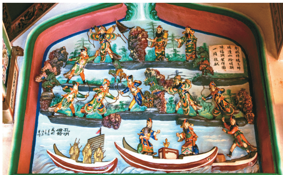
平鎮褒忠祠正殿龍側上《草船借箭》。