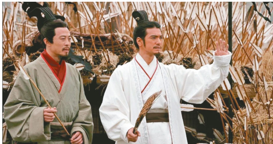
三國是影劇、電玩愛用的題材，圖為吳宇森執導的《赤壁》。