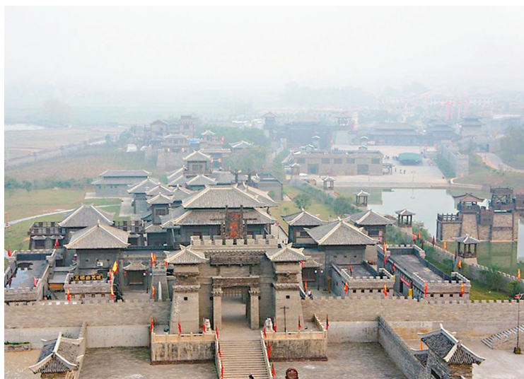
鄰近三國赤壁戰場的仿古建築。

三國歷經無數改編，吸引讀者百讀不厭，IP經濟帶來跨界影響力，是經典再造的絕佳典範。好讀週報與聯合學苑推出「玩轉經典 跨領域三國」系列活動，結合閱讀、直播、遊戲、文創等活動，詳情可上「聯合學苑」。